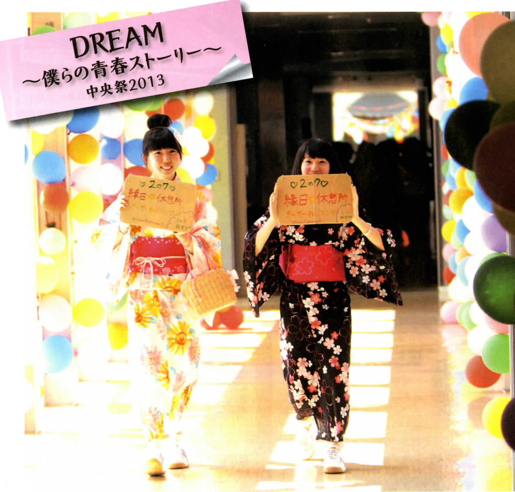
DREAM ～僕らの青春ストーリー～ 中央祭2013

ホームページのご案内「中央高校の全てがわかる」http://www.tsuruokachuo-h.ed.jp/